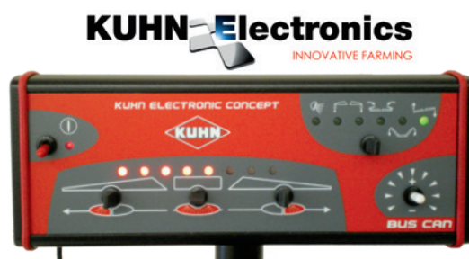
Centralina DPS CAN-BUS